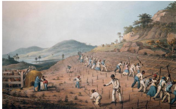
Anónimo (1823). Esclavos en la isla caribeña de Antigua trabajando en plantaciones de caña de azúcar.

La economía durante la Colonia en América se organizó en torno a actividades extractivas . Esto quiere decir que estaba focalizada en la producción de materias primas (recursos que se obtienen de la naturaleza), relacionadas principalmente con la minería, la agricultura y la ganadería . Sin embargo, como ahondaremos en esta guía, hubo diferentes unidades o sistemas de producción dependiendo del clima de