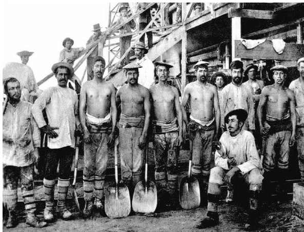
Trabajadores en una salitrera en 1906

Para explotar este mineral, se levantaron en medio del desierto verdaderos pueblos, donde todo el quehacer giraba en torno al salitre. Estos emplazamientos urbanos, conocidos como “oficinas salitreras”, atrajeron a hombres y mujeres de todos los rincones del país, quienes llegaron con la ilusión de mejorar sus condiciones. Sin embargo, la realidad fue otra, como podrás concluir a partir del desarrollo de esta guía. ¡Vamos a ver!