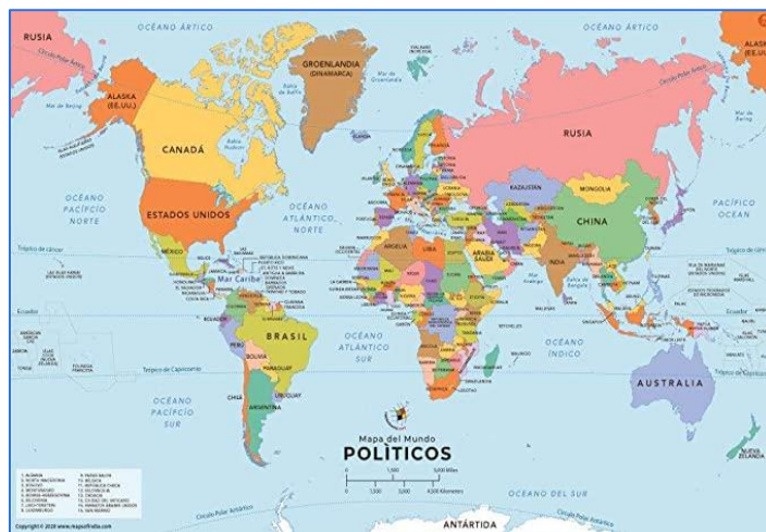
Mapa del mundo