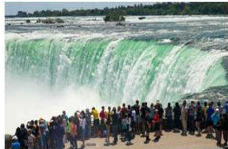
Cataratas del Niágara, Canadá.