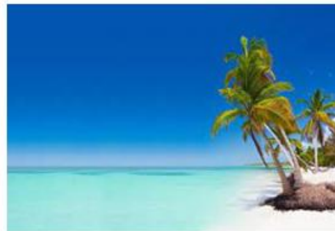
Punta Cana, República Dominicana.