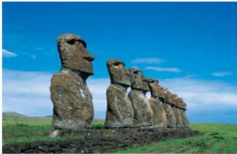
Isla de Pascua, Chile.