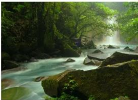
Río Celeste, Costa Rica.