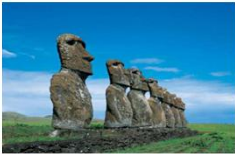
Isla de Pascua, Chile.