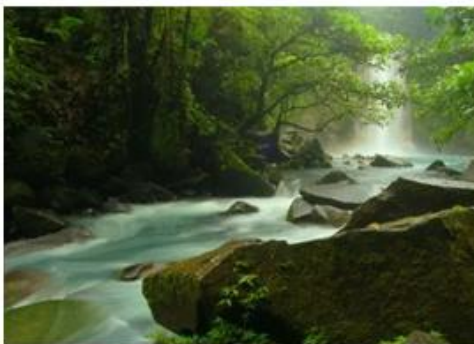
Río Celeste, Costa Rica.