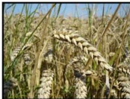
Trigo IX y XIV región.