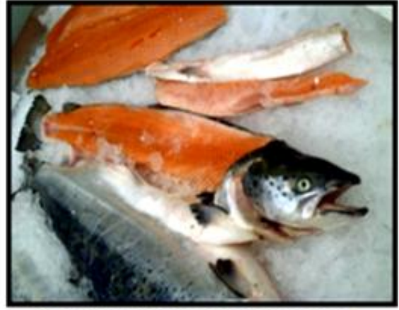
Salmón X región.

¿Con qué actividad económica se relacionan?