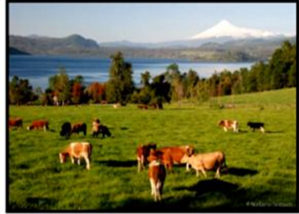
Vacas XIV y X región.

¿Con qué actividad económica se relacionan?