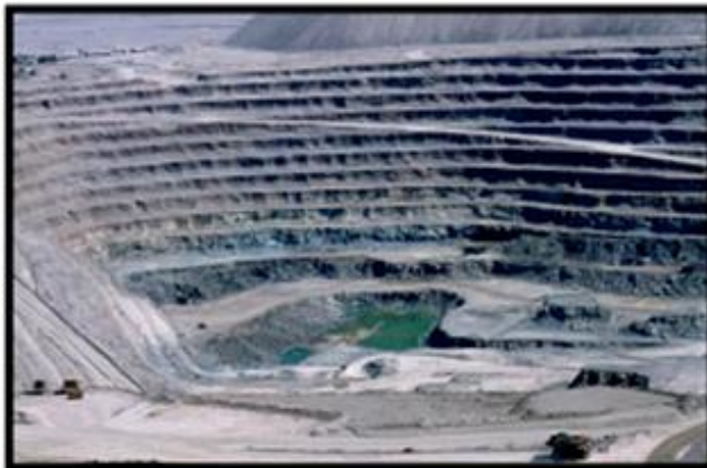
Mina cobre Chuquicamata II región.

¿Con qué actividad económica se relacionan?