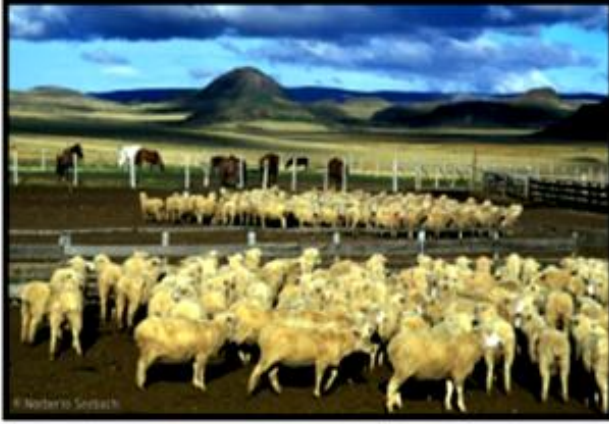
Ovinos XII región.

¿Con qué actividad económica se relacionan?