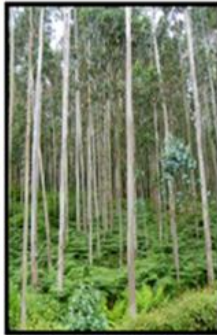
Bosque de Eucalyptus VII región.

¿Con qué actividad económica se relacionan?