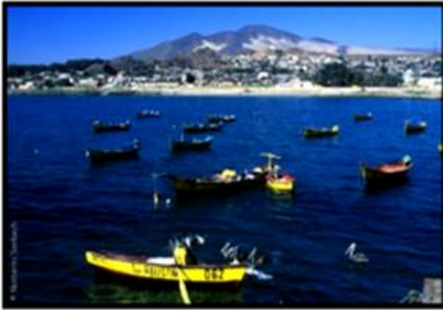
Anchoveta XV a la XIV región (sin RM).