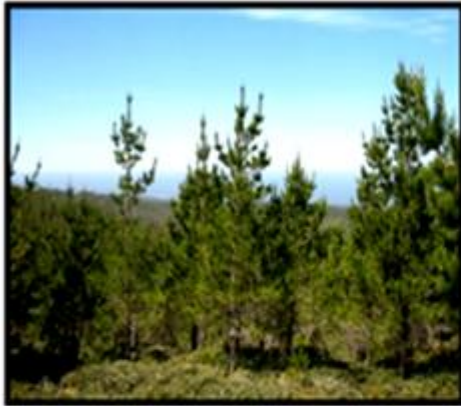
Bosque de Pinos VIII región.

Observe atentamente las siguientes imágenes. Escriba en los recuadros con qué actividad económica se relacionan y dibuje un símbolo representativo.