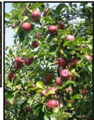
Manzanos VI región.