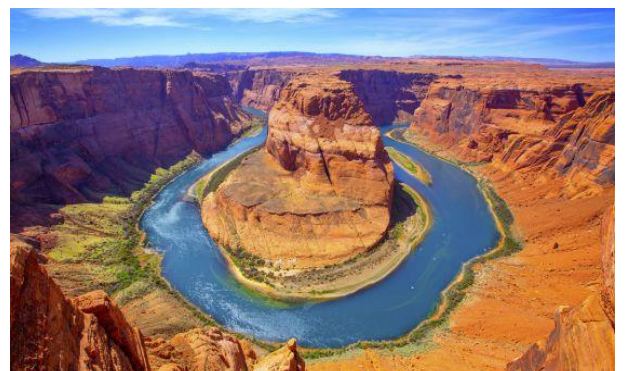
Gran Cañón del Colorado, Estados Unidos.