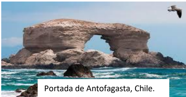
Portada de Antofagasta, Chile.