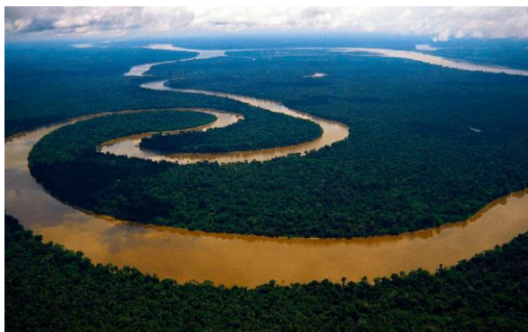
Río Amazonas: Perú, Brasil, Ecuador, Bolivia, Colombia.