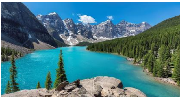
Parque Nacional Banff, Canadá.