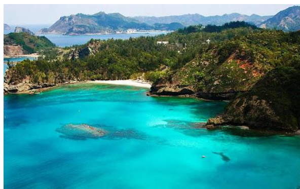
Isla Galápagos, Ecuador.