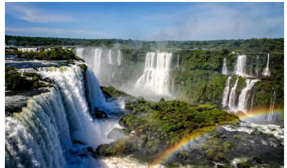
Cataratas de Iguazú, límite entre Argentina y Brasil.