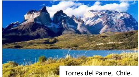
Torres del Paine, Chile.