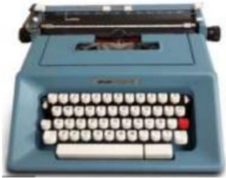
Máquina de escribir