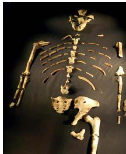
Restos óseos de “Lucy”, hominino de la especie Australopithecus Afarensis, de 3,2 a 3,5 millones de años de antigüedad.

La evidencia científica ha demostrado que grandes primates que hoy conocemos (como el chimpancé o el gorila) comparten un ancestro común con el ser humano. El momento exacto en que el árbol evolutivo separó estas dos ramas (primates y humanos) no está claro, aunque algunos científicos creen que este ancestro común podría tratarse de un simio que habitó los bosques de África hace más de 20 millones de años.